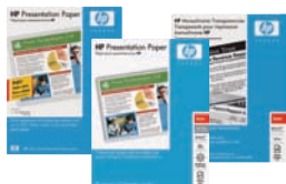
Seleccione entre una amplia gama de papeles HP para crear documentos profesionales