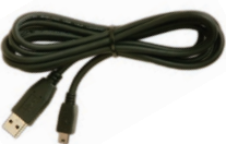
C6518A Conecte directamente su impresora con el cable USB A-B de alta velocidad (2 metros)